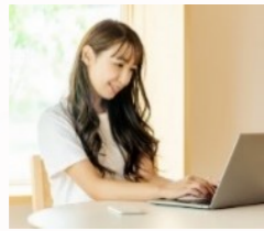
場所を選ばない会議 ハイブリット会議