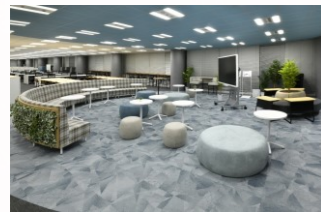
気軽にリフレッシュ コミュニケーション

職種に関係なく外出先や自宅、どこからでも事務所に在席している 環境と同様の活動ができるようなオンライン会議やテレワークの推奨