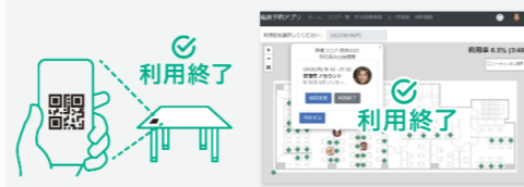
フリーアドレス 座席予約システム