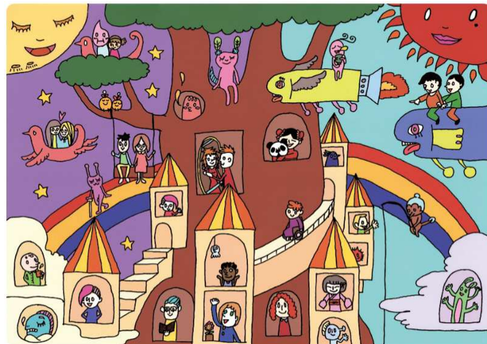
パラリアート サステナビリティ「サステナビリティあふれる未来へ」 by KOTO

リコージャパンは「障がい者アーティストの社会参加と経済的自立」を目的とした一般社団法人 障がい者自立推進機構が運営するパラリアートに賛同し、オフィシャルパートナー(ブラチナ)に参加しました。