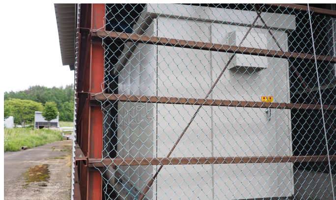
新たに設置されたキュービクル